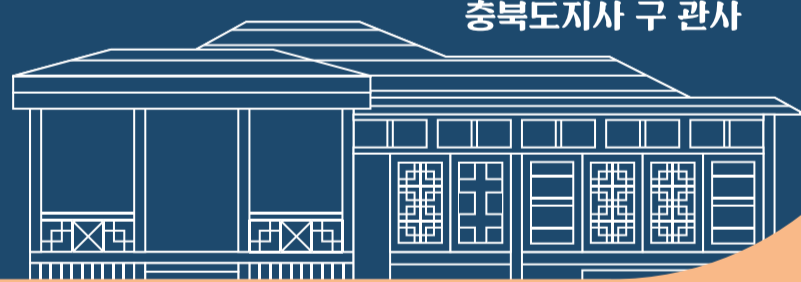
충북도지사 구 관사